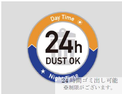
24時間ゴミ出し可能 ※制限がございます。