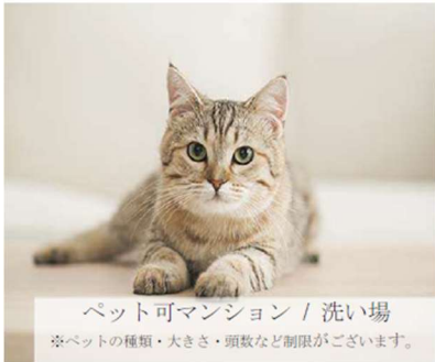
ペット可マンション / 洗い場 ※ペットの種類・大きさ・頭数など制限がございます。