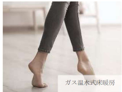
ガス温水式床暖房