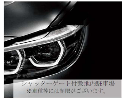
シャッターゲート付敷地内駐車場 ※車種等には制限がございます。