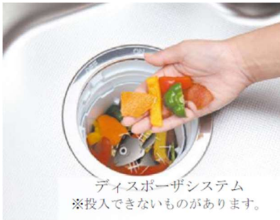
ディスプレイシステム ※投入できないものがあります。