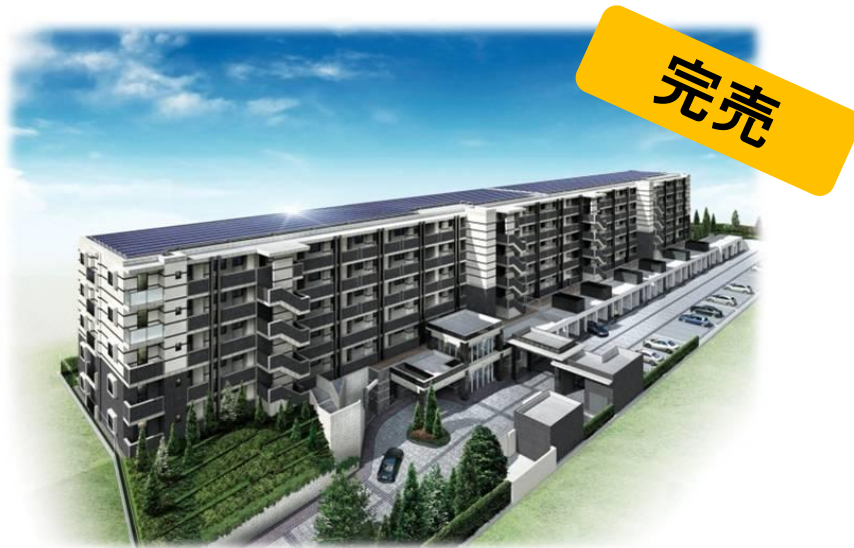
レーベンリヴァーレ横濱鶴ヶ峰ヒルズ