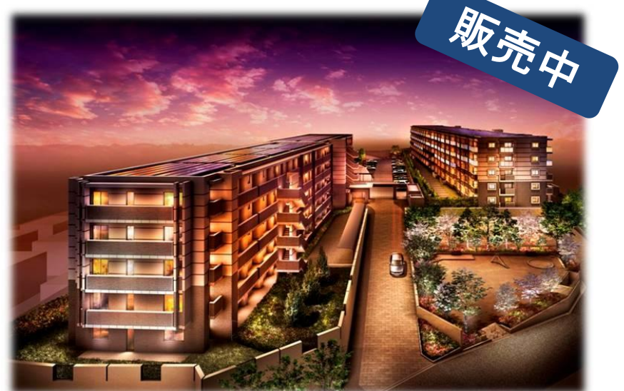
レーベン横濱鶴ヶ峰テラス